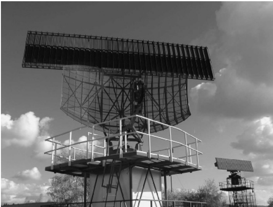
Mode S ontvangstantenne

Overgenomen uit 'Cumulus', clubblad van KVDW