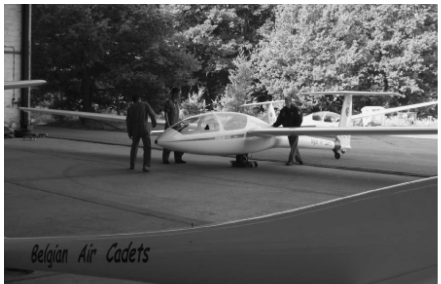
Met de DG500 beschikken de cadetten over topmateriaal

De voertuigen en Pipers mogen we ontlenen van defensie r. en zonder deze steun