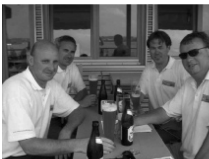
De obligatoire nabespreking