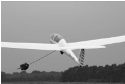
Twin in lierstart

Neen, bepaalde functies mogen enkel door militairen in effectieve dienst of reservist uitgevoerd worden. Dit is het geval voor sleeppiloten, dit moeten actieve piloten of reservisten van Defensie zijn. Maar ook de liermannen, chauffeurs van militaire voertuigen ed... behoren tot deze categorie. De meerderheid op een kamp (zo'n 90%) is echter burger.