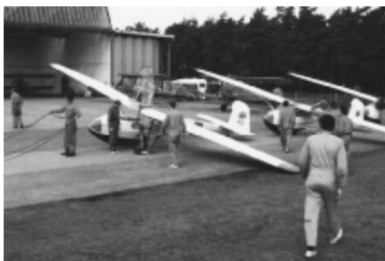
Zoersel anno 1973, Rhönlerches en SV4's

Het is in het verleden al diverse keren geprobeerd, een reünie van oud-Luchtcadetten organiseren, maar echt van de grond is het nooit gekomen. Gewoon omdat het niet zo eenvoudig is.