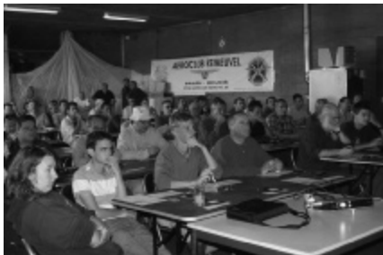
Briefing in hangaar