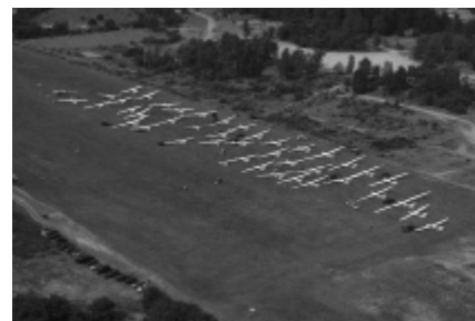
Startplaats Keiheuvel cup 2008