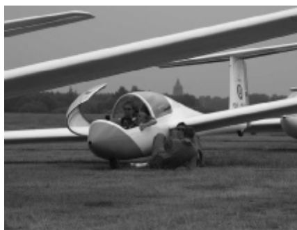
Weelde, startplaats zomerstage 2008

Ik was zelf cadet in 1968. en deed mijn eerste vlucht in 1970. In die periode was de