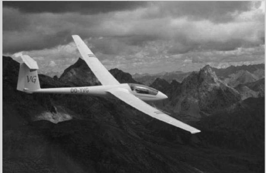
'Chocolat' inzending 2007

De inzendingen zullen beoordeeld worden door een jury. De jury behoudt zich het recht voor om