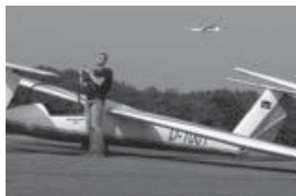
Nog even programma doornemen

Door het kleine aantal actieve kunstvliegers in Nederland en België bestond het deelnemersveld voornamelijk uit Duitsers. Toch waren het piloten uit het gastland die