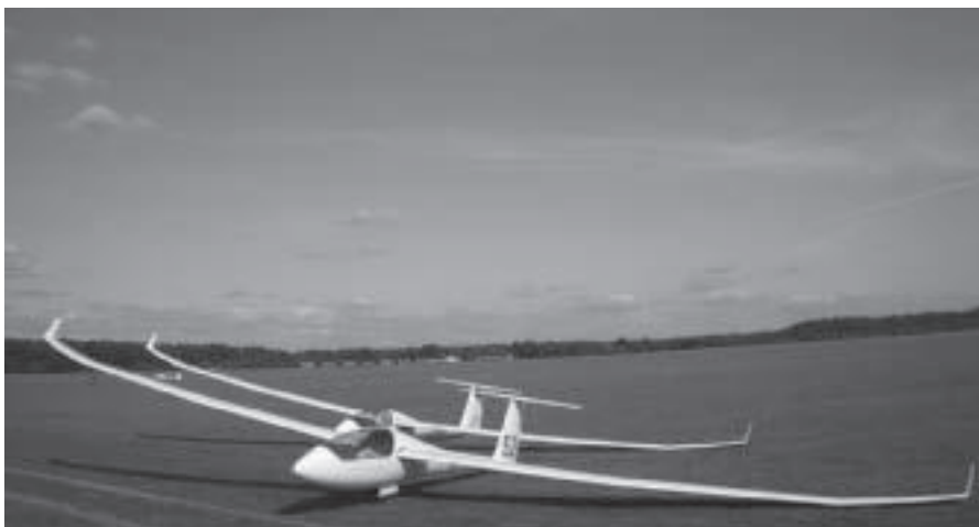
De Discussen 21 en 52

Yves (ES) moest steeds weer in zijn eentje tegen de goed geoliede Duitse, Franse, Engelse en vooral Nederlandse teams opboksen. Met bravoure vocht hij dag na dag voor wat hij waard was. Na 13 vermoeiende wedstrijddagen kon hij na zijn 1 ste internationale kampioenschap terugkijken op een mooie 23 ste plaats. Voor de standaardklasse-piloten verliep de 1 ste gemeenschappelijke wedstrijd in teamverband, met grote up's en kleine down's. De ambitieuze proeven (2 keer > 500 km), die echter steeds voltooibaar waren, zorgden voor een aantal buitenlandingen. Zodoende kregen we, ondanks de vele grote en lange vluchten, het golvende Litouwse landschap toch nog van dichtbij te zien. Over het algemeen beschouwd vlogen de twee Discus 2's een mooie reeks dagprestaties en bewezen op de goede dagen met de (sub)top mee te