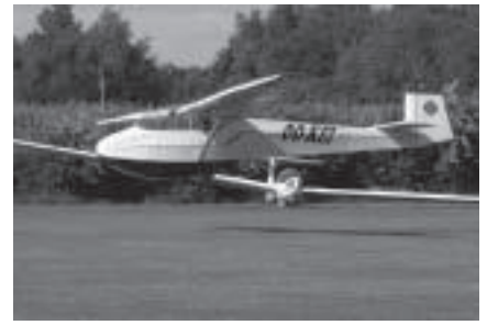
De 50-jarige OO-KEI in actie

De leden van Limburgse Vleugels in Zwartberg zetten op 18 juli hun beste vleugeltje voor ism de Sint-Gerardusschool in Diepenbeek, een school voor buitengewoon secundair onderwijs. De anders-