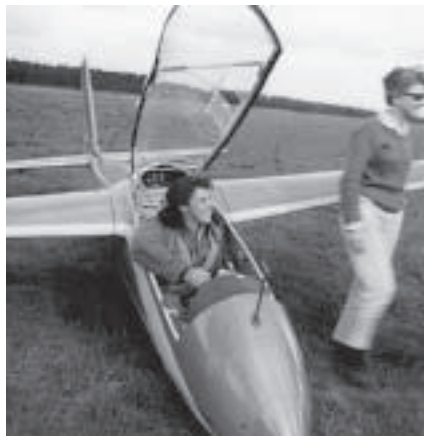
Gill op Mucha, waar zij haar BR van +7 uur mee gevlogen heeft

Gill: Wat moet ik daarover zeggen? (schraapt haar keel) Dat zouden in feite anderen moeten doen, maar goed. Het