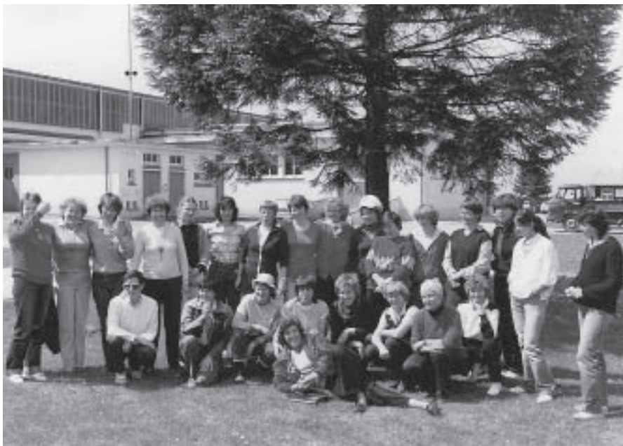
Gill tijdens vrouwen EK op St. Hubert